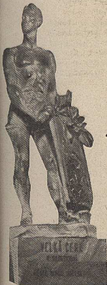
Velká cena města Ml. Boleslavě v desetibojí. Po akad. sochaře J. Malejovského. Odboru věnoval Vlad. Kvapil.