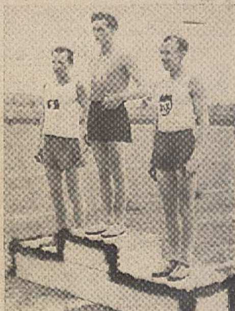
Mistrovských 1500 m — Strahov: Zátopek, Čevona, Dolenský.