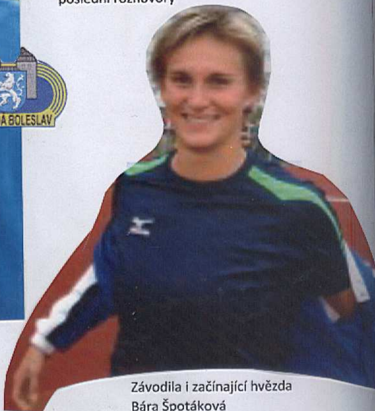
Závodila i začínající hvězda Bára Špotáková