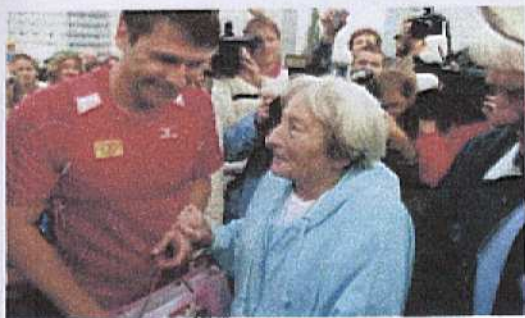
Na rozlučku s Honzou přijela oštěpařská legenda Dana Zátopková