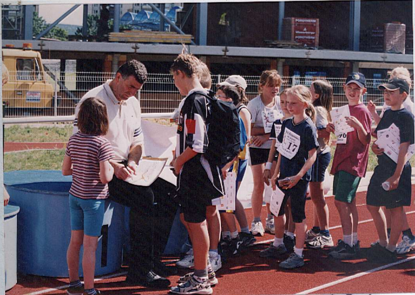
Mladí závodníci prosí mistra světa v hodu diskem Imricha Bugára o podpis a ten se všem zájemcům ochotně podepisuje.