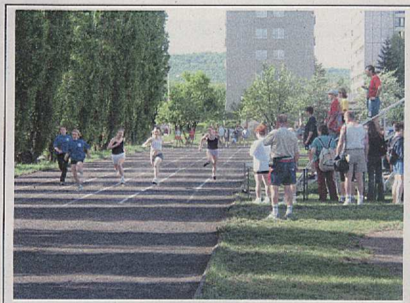
Treninkové hřiště ZŠ Jilemnického