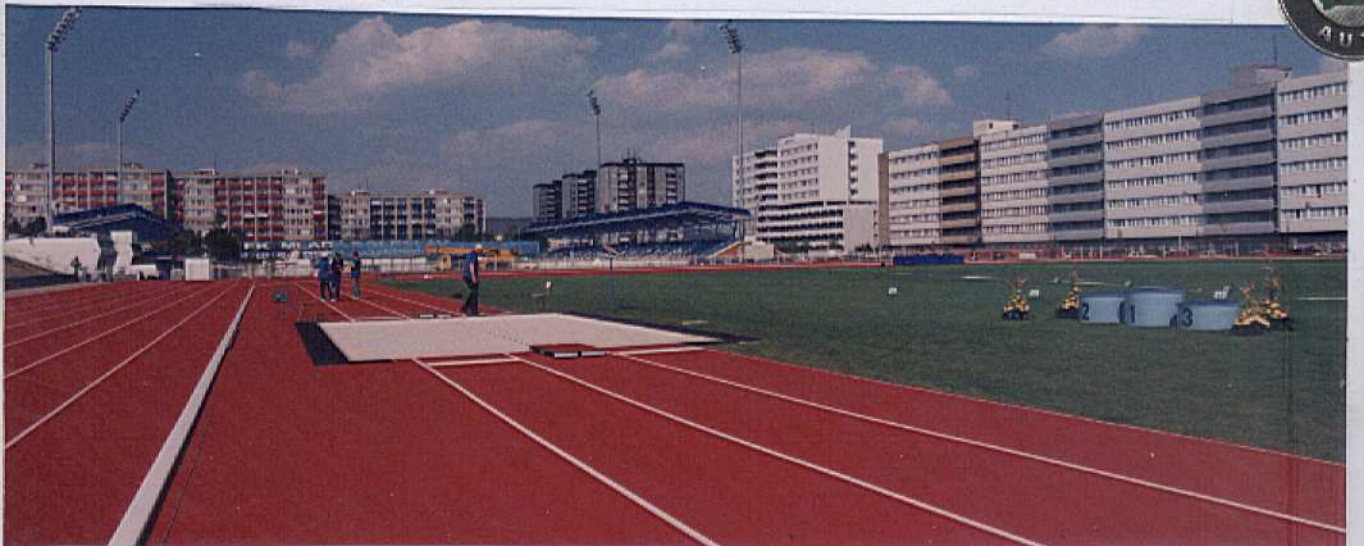
Slavnostního otevření se zúčastnila legenda československé a české atletiky olympijská vítězka z Helsinek 52 Dana Zátopková.