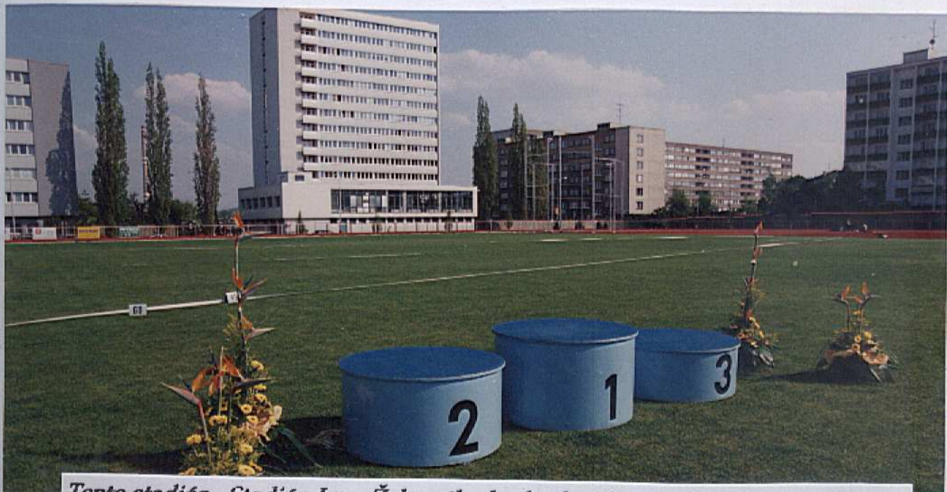
Tento stadión „Stadión Jana Železného“ bude sloužit stávající a nastupující generaci. Zatím je to polotovár - bez jakéhokoliv sociálního zázemí. Oficiální otevření bylo 28.4.2004.