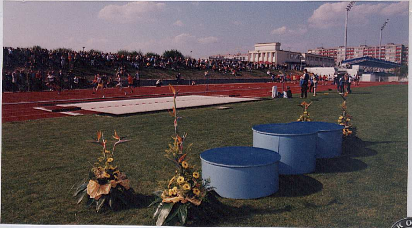
Pohled na stadión Jana Železného z několika stran.