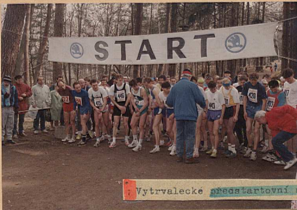
• Vytrvalecké předstartovní napětí. •

SPONZOŘI JUBILEJNÍ „ŠEDESÁTÉ“ ŠTĚPÁNKY: CARTEC, spol. s r. o., MB • KAF, CLEAN SERVICE • BESTAR • CORAL CAFE • ELIN • PHYSICO • TEXTIL ŠTEPÁNKA • AZ FOTO • PAPIRNICTVÍ DUO • AUTO MARTINEK • DK SERVICE • JELÍNEK LAURETA • LIDKA • BONAS • AIK PRESS •