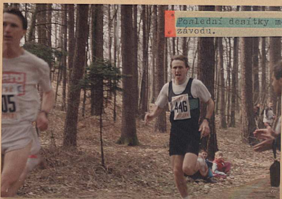
• Poslední desítky metrů nejdelšího závodu. •