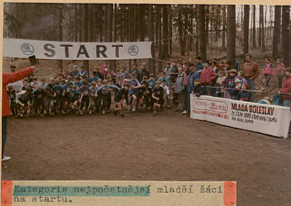
Kategorie nejpočetnější mladší žáci na startu.

Letošní tratě budou vedeny tak, aby bylo možno pozorovat běžce v podstatě z jediného místa od hudebního pavilónu ( a to po vzoru různých evropských krosů ) • Občerstvení v prostoru pavilónu bude po dobu závodu zabezpečovat firma OAZA Pavla Lörince • V době uzávěrky těchto informací potvrdila svůj start belgická ekipa v čele s prezidentem klubu z města Ronse, každým dnem jsou očekávány potvrzené přihlášky z Německa (Wolfhagen, Walldorf) i Portugalska