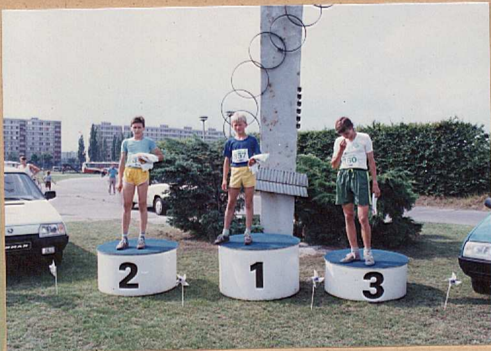
Trio nejrychlejších mladších žáků na bedně