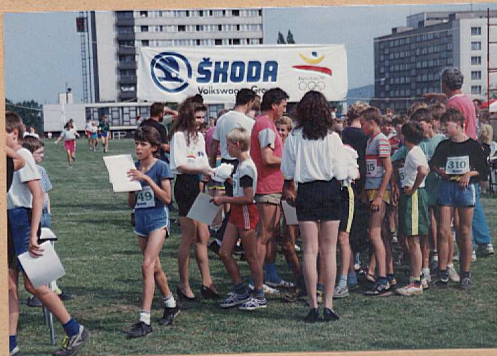
Mumraj v cíli - šlo o suve- hýry