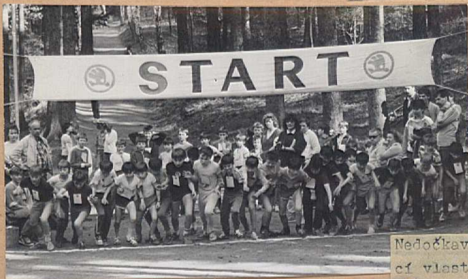
Nedočkavost byla v tuto chvíli rozhod- cí vlastností mezi startujícími běžci 500 m mladších žáků .