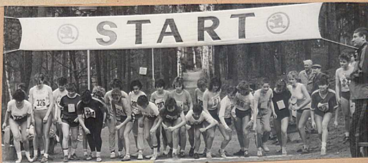
Společný start žen i obou kategorií dorostenek .